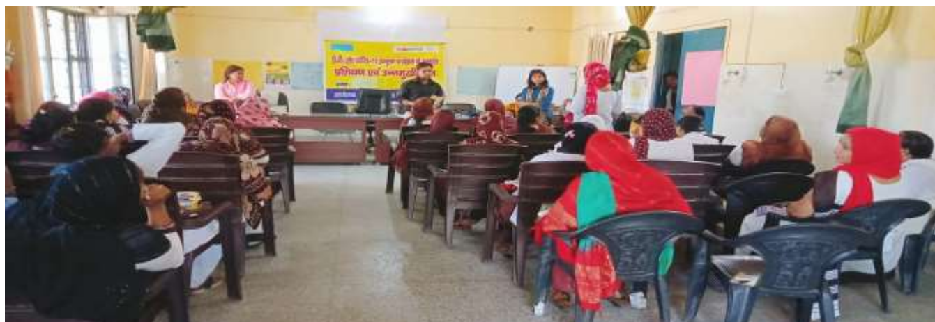
Orientation of ASHA and AWW workers on TB and COVID 19