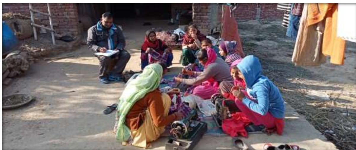
Skill training to adolescent girls and women on tailoring