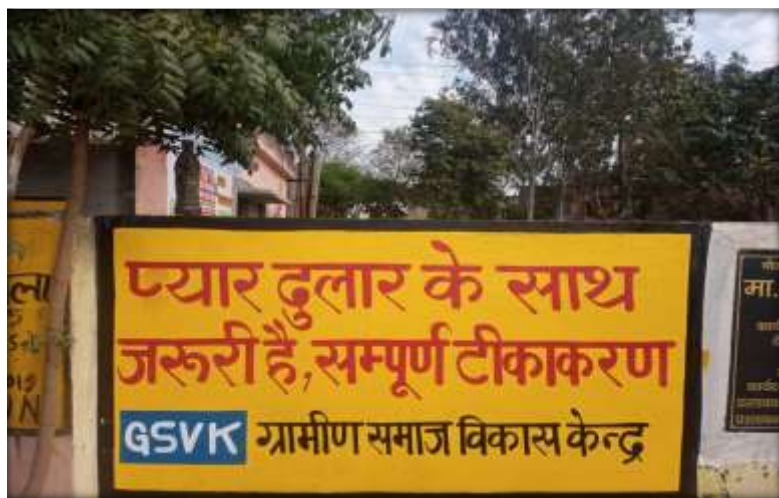
Wall writing on immunization and other health issues