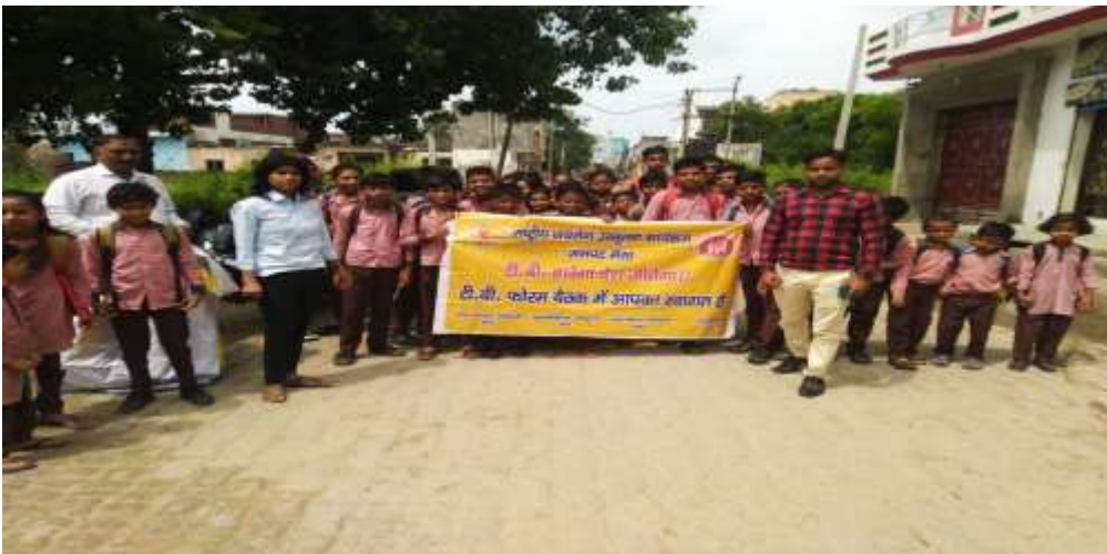
Awareness Rally on Tuberculosis in 6 villages of Block Rajpura, District Meerut