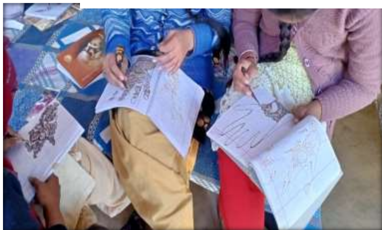
Skill training to adolescent girls and women on beautician