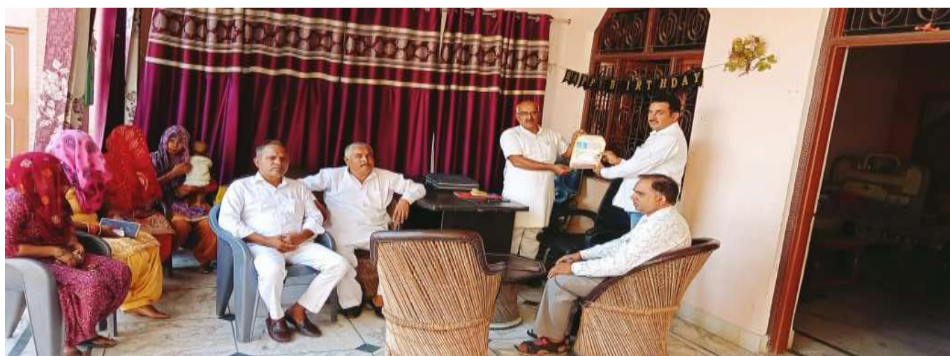
Orientation of PRI Members on Tuberculosis