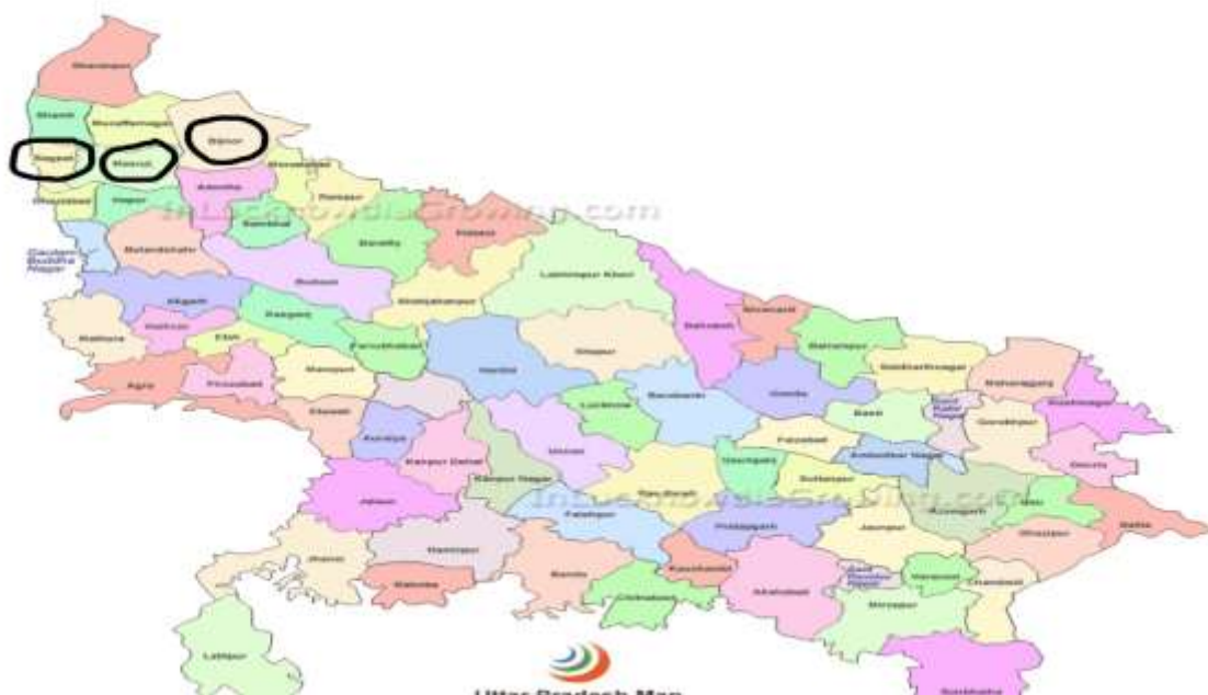
Operational Area of GSVK in Uttar Pradesh