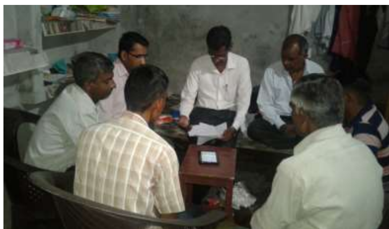
Focus Group Discussion in District Meerut