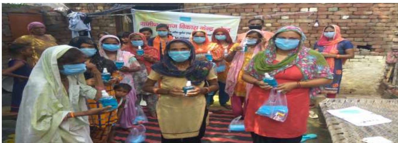
Distribution of Sanitizers, Mask, Soap and Sanitary Pads to women and adolscent girls during Covid period