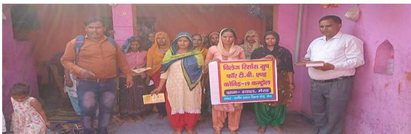
Formation of Village Resource Group