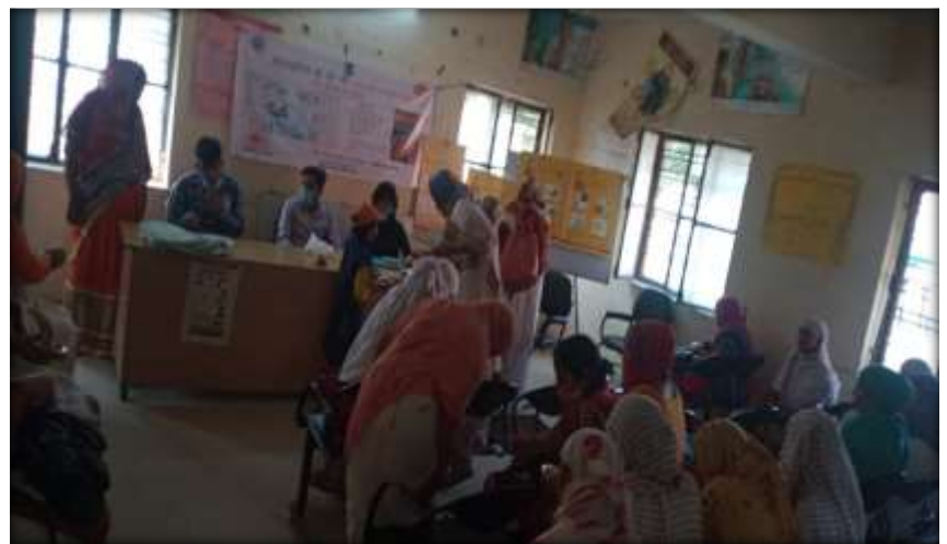
Awareness meeting on different social issues to the SHGs and adolescent groups.