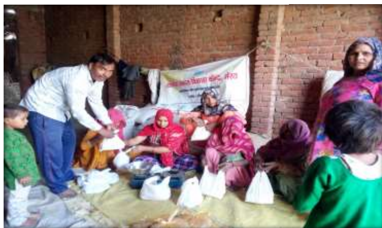
Covid relief distribution