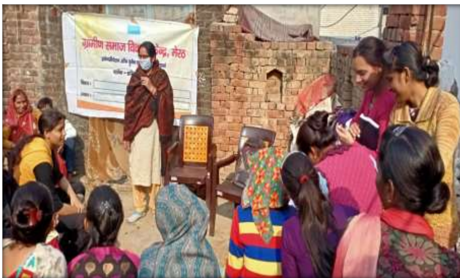
Training on puberty Changes to adolescent groups.