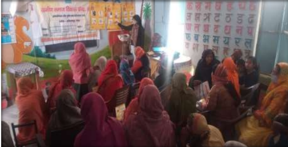
Capacity Building of the Group Leaders on Group Management