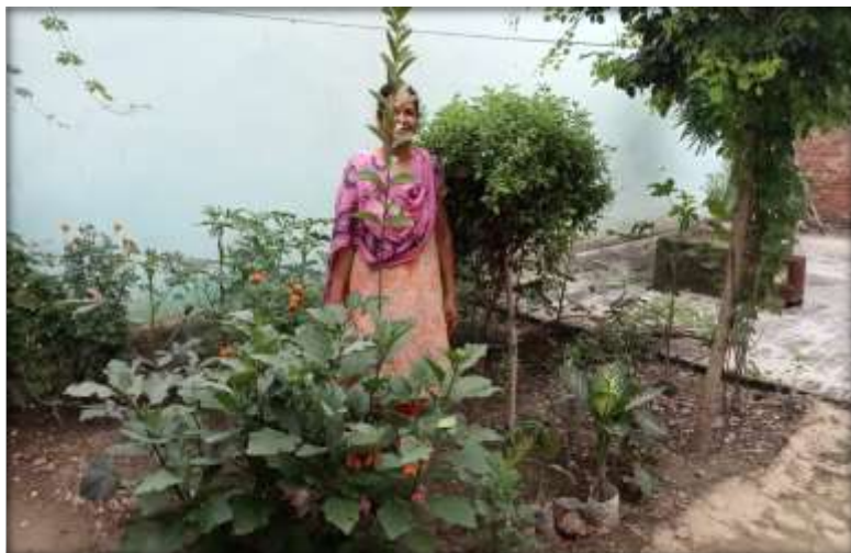
Promotion of Kitchen Garden