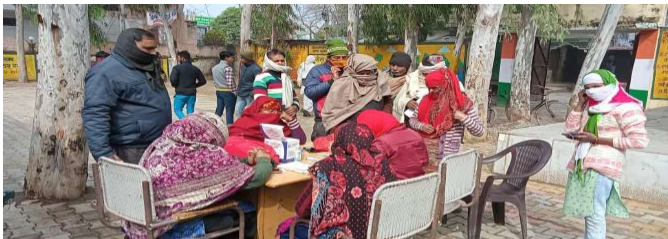
COVID 19 Vaccination Program