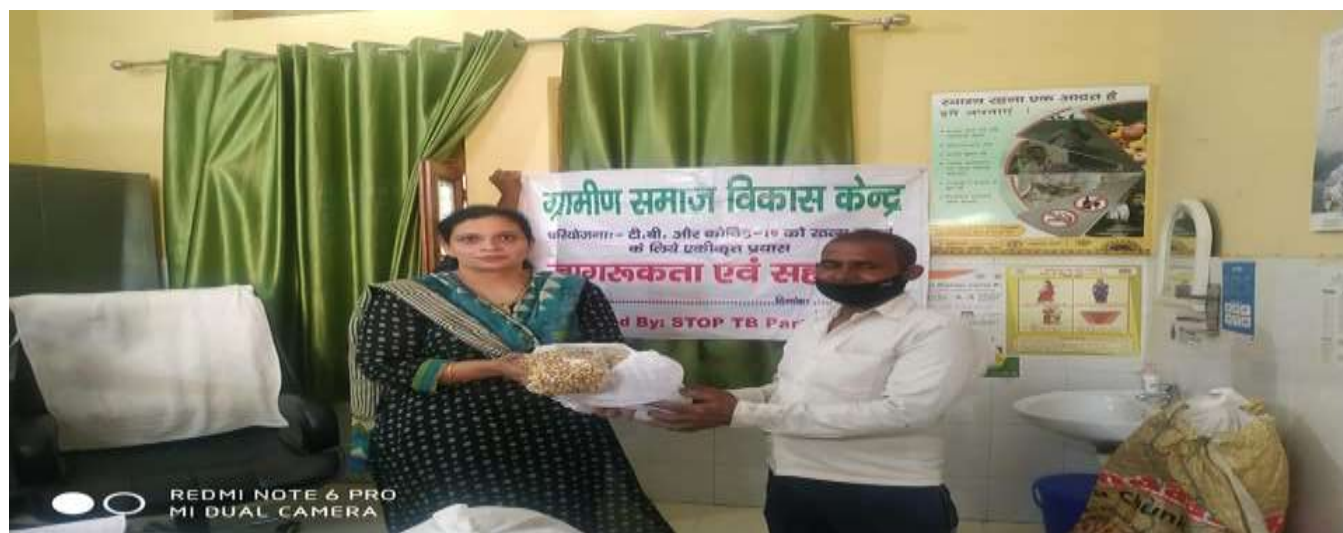
Distribution of Ration to TB patient by MOIC