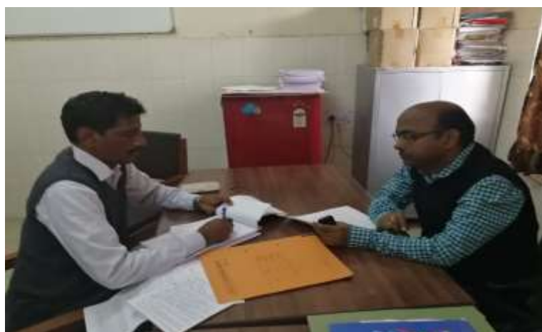
Indepth Interview with Media Person